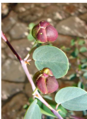
קפריסין – פקעי הפרחים של הצלף