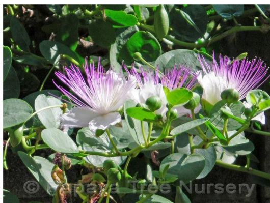
צלף עם קפריסין ואביונות

ביקשו מחבריהם ובני ביתם להוציא 16 את הביטתא, האביונות, בלבד, ולאחר הוצאת האביונות התיירו להם לכבוש את הקפריסין של ערלה. רבי בא הסביר בשם רבי זירא שלשיטת רב הקפריסין אינם קליפות, כיוון שאין הם גדלים עם הפרי אלא למטה ממנו. פרשני הירושלמי נדחקו לפרש את הדברים הללו, שכן הקפריסין אינם גדלים מתחת לאביונות. הם ניצנים סגורים לחלוטין המתפתחים לפרחים שמתוכם צומח עוקץ ארוך, ורק לאחר נשירת הפרחים גדל על עוקץ זה תרמיל שהוא הפרי, האביונה. הקפרס עצמו איננו קליפה המכסה חלקית על האביונה מלמטה: לכל היותר ניתן לראות בפרח הצומח מן הקפרס "קליפה" מעין זו, אך גם פרח זה נושר לפני שצומחת האביונה. 17 ושמא יש לפרש את דברי רבי זעירא כך: על אותו שיח גדלים בו בזמן פרות בשלים, אביונות, בחלק העליון של השיח ("מלמעלן"), וניצנים, קפריסין, על חלקו התחתון ("מלמטן"). ודבר אין להם זה עם זה: רק באופן תאורטי מאוד ניתן לראות בניצנים הסגורים, הקפריסין, "קליפות" שמהן יצמחו פרחים שמהם תצמחנה האביונות. 18 וכך מצאנו בצילומים של שיח הצלף שבהם נראים על שיח אחד קפריסין ואביונות, שהאביונות מופיעות בחלק העליון של השיח והקפריסין בחלק התחתון. 19