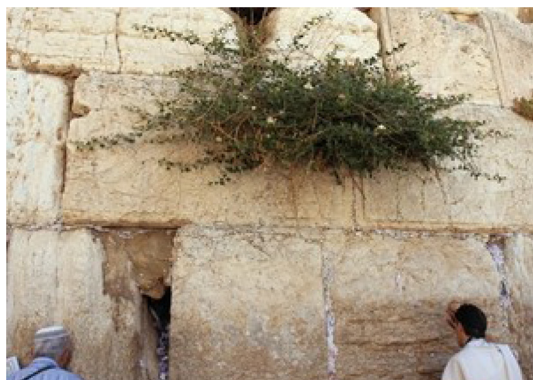
שיח הצלף בכותל המערבי

לפי אברהם וייס כללה הסוגיא המקורית את החלקים א, ב וד בלבד, 1 וביסוד הסוגיא המקורית עמדה המימרא של רב שנמסרה על ידי רב יהודה [1], והדיון בה [2-7, 13-21] שרובו דברי אמוראים. על ההבחנה שהבחין רב בין שני חלקי הצלף [1] מקשים משני מקורות: מן הברייתא שהובאה בסוגיא הקודמת [2] שלפיה מברכים "בורא פרי העץ" הן על האביונות והן על הקפריסין, וממדרש הלכה אנונימי [13] – הנתפס אף הוא במקצת עדי הנוסח כברייתא 2 – שלפיו לא רק הפרי אלא גם "שומר לפרי" חייב בערלה. 3 על הקושיא הראשונה מתרצים ששאלת מעמדם של הקפריסין שנוי במחלוקת תנאים במשנה מעשרות ד ו: רבי אליעזר מחשיב אותם כפרי, והברייתא בעניין הברכה היא כשיטתו, ואילו רבי עקיבא סבור שאינם פרי, וכשיטתו פסק רב לגבי ערלה בחוץ לארץ [3], שכן "כל המקל בארץ", שבה ערלה אסורה מן התורה, "הלכה כמותו בחוץ לארץ", ששם ערלה אינה אסורה אלא מדרבנן [4-7]. 4 לקושיא השנייה מובאים שלושה תירוצים של רבא [14, 16 ו-20], כששני הראשונים נדחים על ידי האמוראים על סמך מקורות תנאיים [15, 17-19], והאחרונה עומדת [21]. לפי תירוץ אחרון זה, המיוחס לרבא, הקפריסין אינם נחשבים "שומרי" האביונות מכיוון שגם לאחר נטילת הקפריסין אין האביונות מתות, וכפי שמוכח ממעשה שהיה [22].