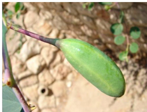
אביונות – פרי הצלף